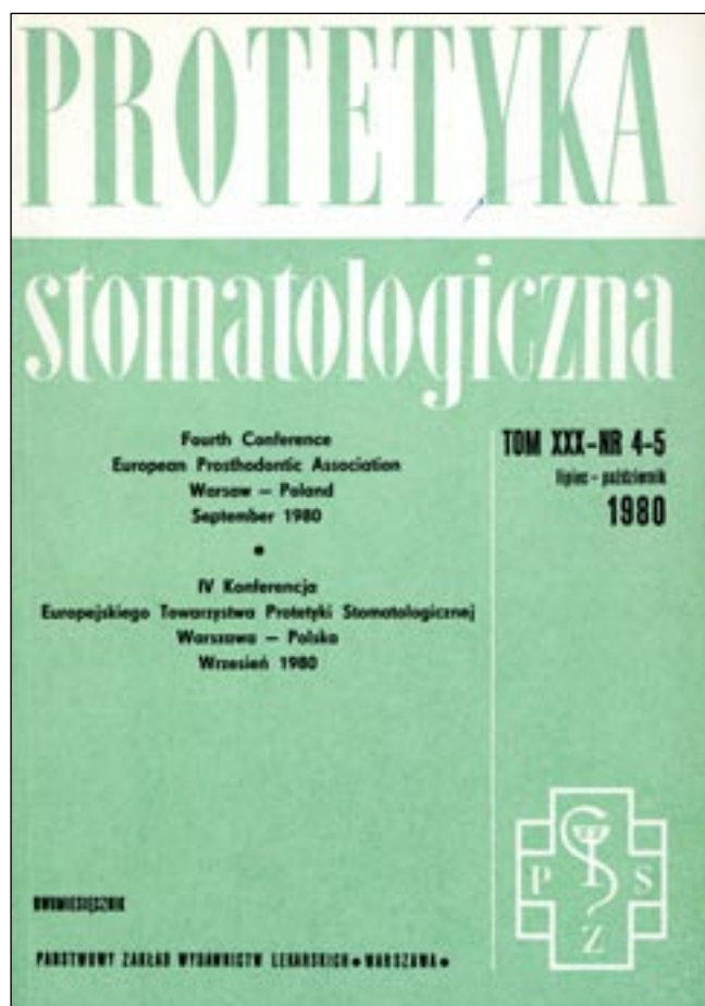
Ryc. 7. Numer Protetyki Stomatologicznej wydany z okazji IV Konferencji Europejskiego Towarzystwa Protetyki Stomatologicznej (EPA) wrzesień 1980 rok.

Coraz więcej było publikowanych prac z ośrodków zagranicznych. Po 20 latach istnienia pismo zostało ocenione przez Polską Akademię Nauk.