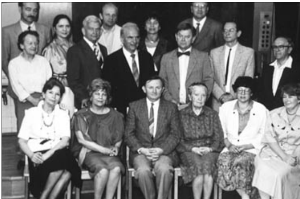
Ryc. 6. Posiedzenie Kolegium Redakcyjnego z okazji 20-lecia Protetyki Stomatologicznej.

W pierwszym 20-leciu działalności pisma, tradycją stało się wydawanie specjalnych numerów poświęconych zebraniom międzyklinicznym, ogólnopolskim konferencjom Sekcji Protetyki PTS oraz wspólnym posiedzeniom Sekcji Protetyki PTS i NRD (ryc. 6). Dużym wydarzeniem, wymagającym ówczesnie ogromnego nakładu pracy było wydanie specjalnego numeru poświęconego IV Konferencji Europejskiego Towarzystwa Protetyki Stomatologicznej, które odbyło się we wrześniu 1980 roku w Warszawie (ryc. 7). Numer ten zawierał pełny tekst lub obszernie streszczenia wszystkich referatów w języku polskim i angielskim. Został doręczony uczestnikom konferencji przed rozpoczęciem obrad. Tradycja ta utrzymuje się do dnia dzisiejszego.