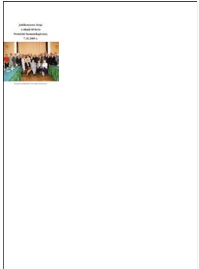
Ryc. 9. Jubileuszowa Sesja Kolegium Redakcyjnego z okazji 40-lecia Protetyki Stomatologicznej.