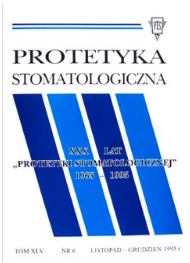
Ryc. 8. „Protetyka Stomatologiczna” w nowej szacie graficznej.