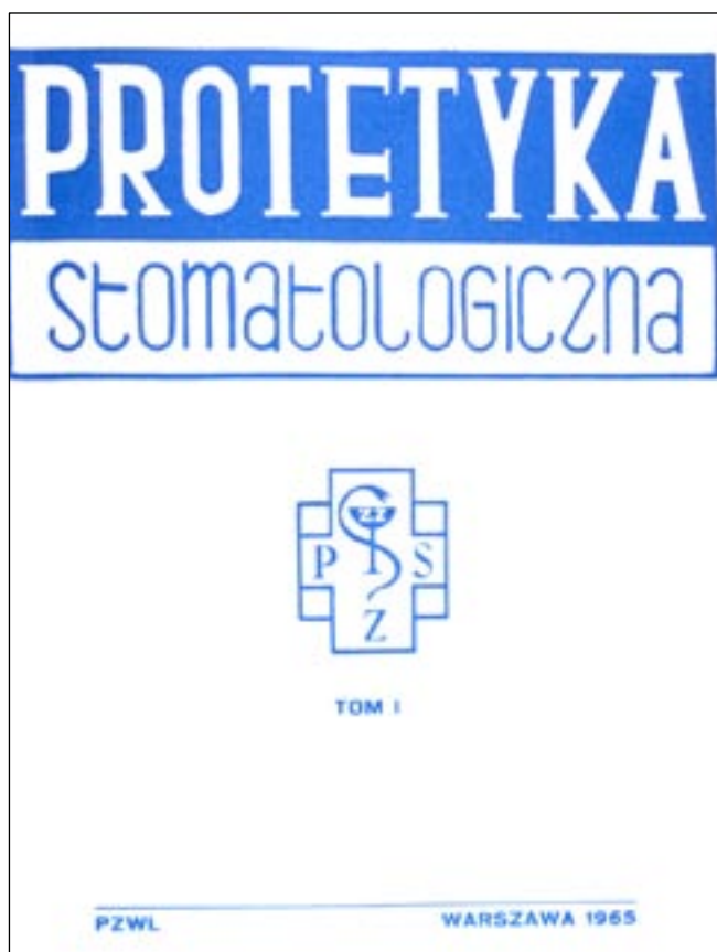
Ryc. 1. Strona tytułowa pierwszego numeru czasopisma „Protetyka Stomatologiczna”.

Pierwszy tom „Protetyki Stomatologicznej” ukazał się w październiku 1965 roku. Było to pierwsze w Europie czasopismo specjalistyczne poświęcone protetyce stomatologicznej (ryc. 1).